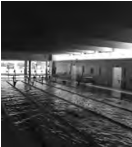
Vista general de la piscina municipal. Ajuntament de Sant Feliu de Guíxols. Premsa. (Autor: Pere Carreras)

La piscina municipal de Sant Feliu de Guíxols va obrir a mitjan gener les portes després d'estar tancada uns dies per Nadal. L'Ajuntament i la nova concessionària han consensuat mesures per millorar la gestió realitzada fins ara, com, per exemple, l'ampliació de l'horari d'obertura, l'ampliació del programa d'activitats i la inversió de 600.000 € en millores.