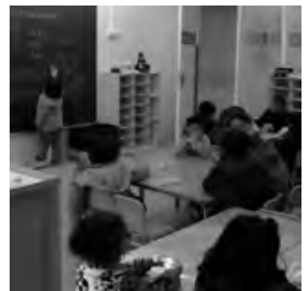
Jornada de portes obertes del CEIP L'Ardenya. Ajuntament de Sant Feliu de Guixols. Premsa. (Autor: Pere Carreras)

Aquest gener el CEIP Ardenya va organitzar unes jornades de portes obertes per ensenyar les noves instal·lacions a pares i alumnes. La nova escola –que substitueix els mòduls prefabricats ocupats durant cinc anys– té capacitat per a 450 alumnes. La línia d'educació infantil disposa de 6 aules de 55m 2 , una aula de psicomotricitat de 60 m 2 i una aula per a grups petits. L'espai destinat a l'educació primària consta de 12 aules de 50 m 2 cadascuna i de 4 per a grups reduïts, a més d'aules d'audiovisuals i música, informàtica, plàstica i una biblioteca, com també d'un gimnàs de 200 m 2 equipat amb un escenari. Els patis tenen una superfície de 600 m 2 per a cada línia, un porxo de 180 m 2 , una pista poliesportiva i un hort de 200 m 2 .