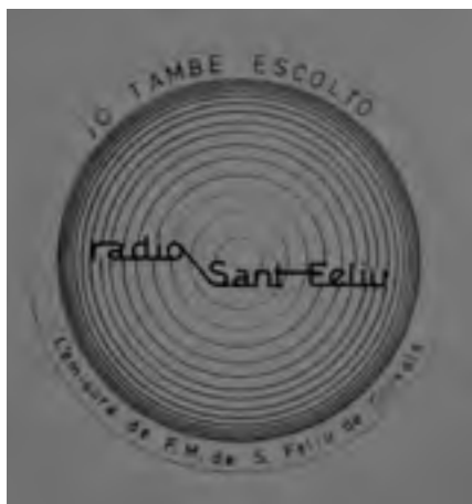
Logotip de promoció de Ràdio Sant Feliu de principi dels anys vuitanta. Procedència: Josep M. Alejandre. (Autor logotip: David París)

PRESENTACIÓ Ràdio Sant Feliu compleix 30 anys. Al novembre de 1980 va néixer aquesta emissora, per la fusió de les joves Ràdio Juliola i Ràdio Ferrerito, que tot just feia mesos que funcionaven. L'encert de l'aliança, que va sumar energia i il·lusió, va originar un mitjà amb una trajectòria llarga, que ha sabut vincular-se a la ciutat i que ha ofert professionals reconeguts en el món de la comunicació.