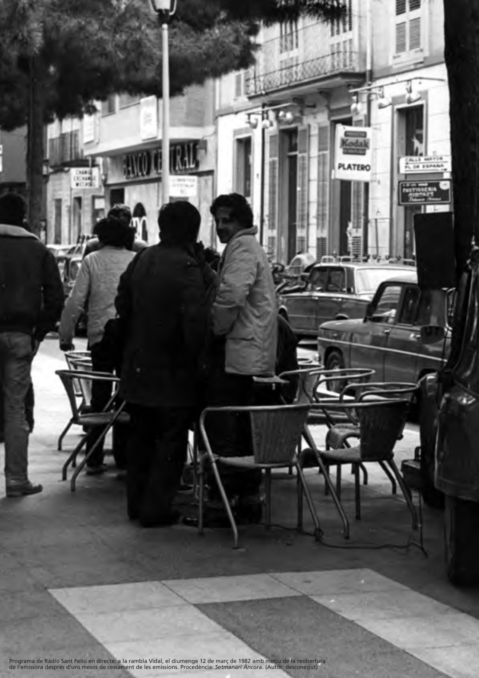
Programa de Ràdio Sant Feliu en directe, a la rambla Vidal, el diumenge 12 de març de 1982 amb motiu de la reobertura de l'emissora després d'uns mesos de cessament de les emissions.