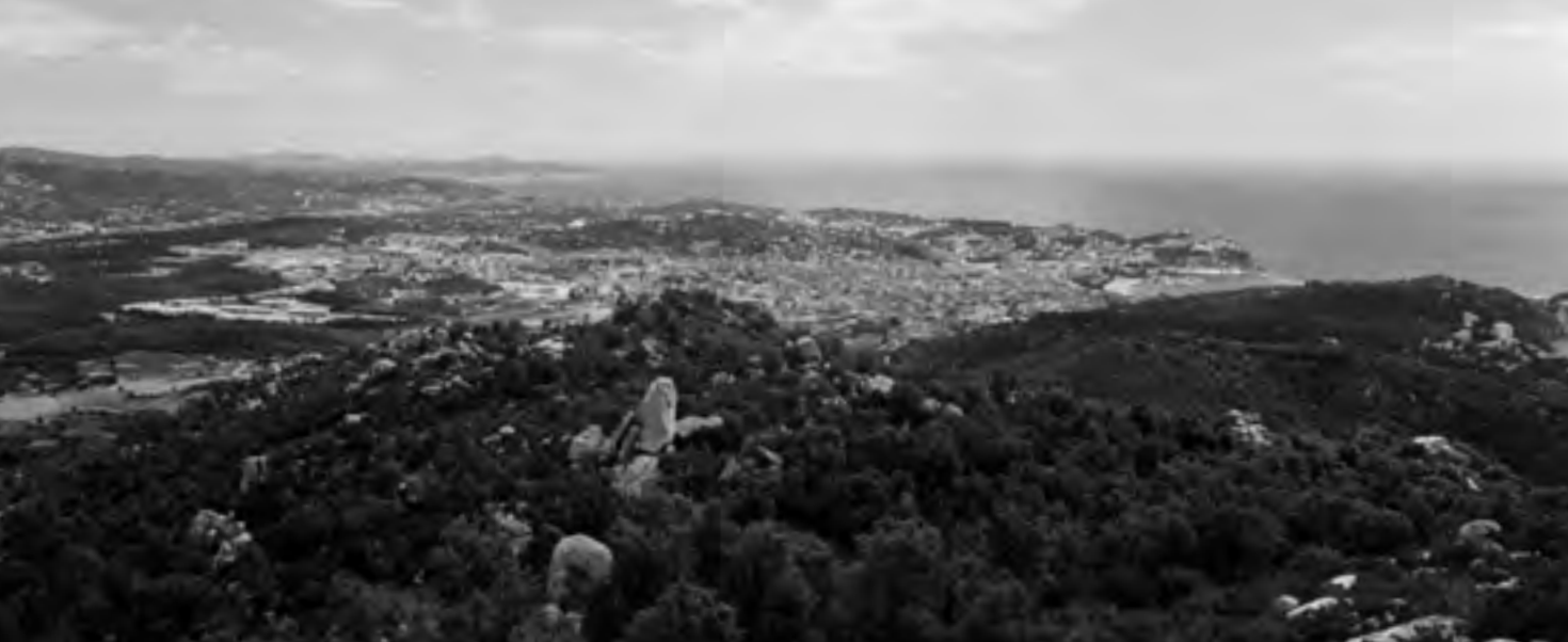
Vista panoràmica de la ciutat des de l'antena de Ràdio Sant Feliu, al puig Gros, el 1991.