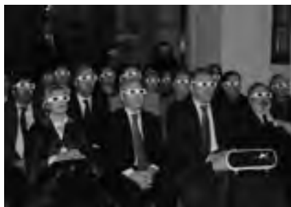
Presentació de les línies del futur projecte executiu del Centre d'Art de Pintura Catalana Carmen Thyssen - Bornemisza. Ajuntament de Sant Feliu de Guíxols. Premsa. (Autor: Pere Carreras)

A mitjan mes de gener, els arquitectes de l'estudi Bopbaa van presentar les línies del futur projecte executiu per mitjà d'una sessió a la qual van assistir Carmen Thyssen i José Montilla, entre altres autoritats. Es preveu que aquest projecte estigui enllestit la primavera vinent i que les obres puguin començar el 2011, amb la intenció d'inaugurar el centre el 2013. La proposta contempla l'exposició de la magnífica pinacoteca de pintors catalans (bàsicament dels segles XIX i XX) de la Col·lecció Thyssen-Bornemisza, a més de l'organització d'exposicions temporals.