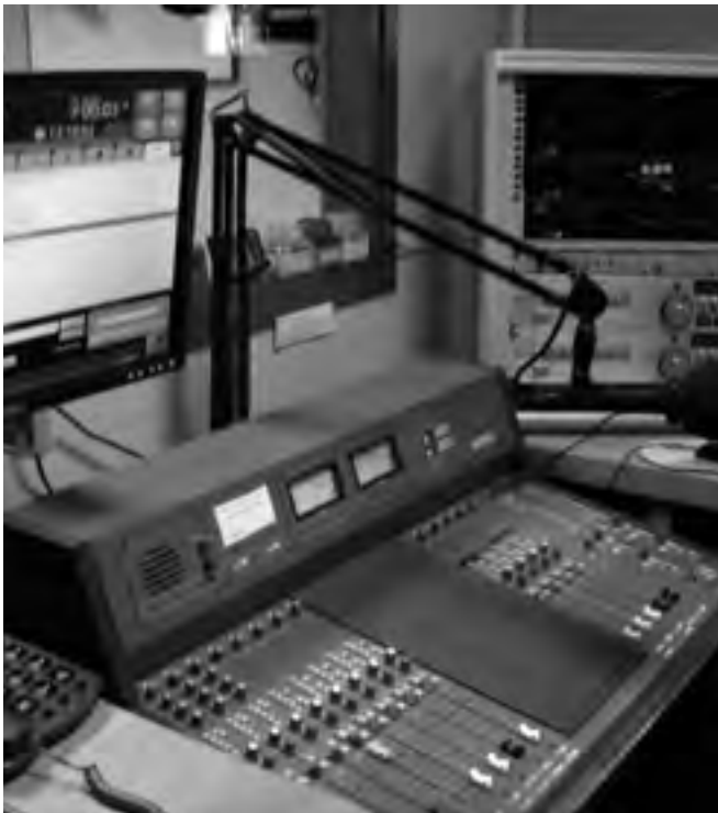
Detalls de l'estudi de Ràdio Sant Feliu, al febrer de 2010. Procedència: Ràdio Sant Feliu. (Autor: Josep Andújar)